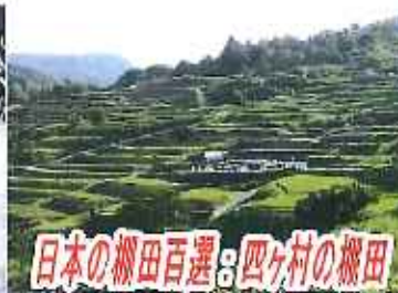
日本の棚田百選：四ヶ村の棚田