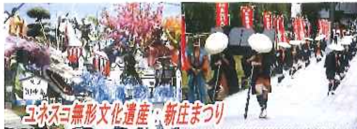
ユネスコ無形文化遺産：新庄まつり